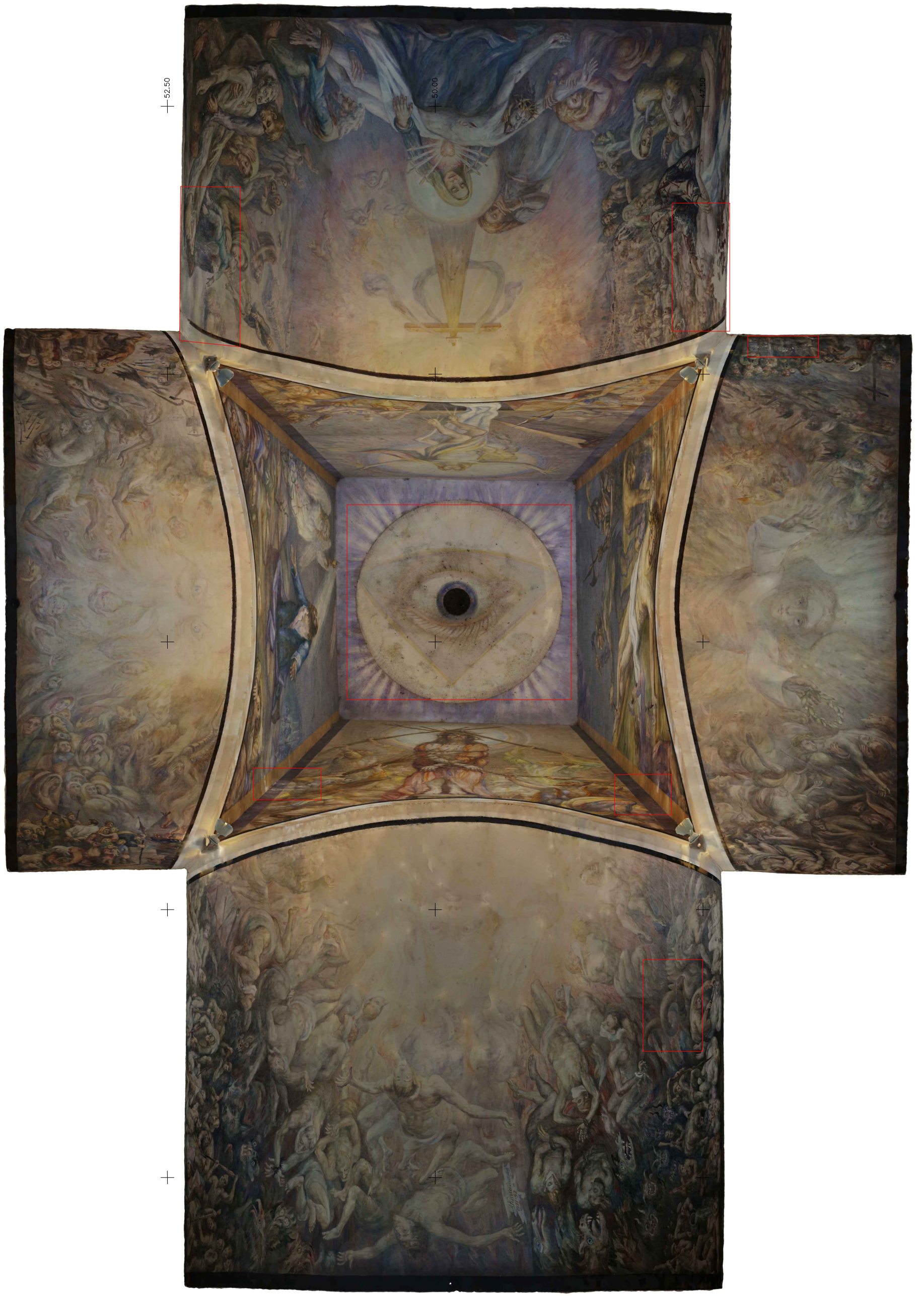
Labiausiai pažeistos tapybos vietos, kurias reikia tirti